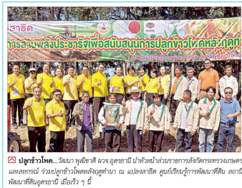
☑ ปลูกรั้วไผ่... วัฒนา พุฒิชชาติ ผวจ.อุตรธานี นำหัวหน้าส่วนราชการสังกัดกระทรวงเกษตรและสหกรณ์ ร่วมปลูกรั้วไผ่หลังฤดูทำนา ณ แปลงสาธิต ศูนย์เรียนรู้การพัฒนาที่ดิน สถานีพัฒนาที่ดินอุตรธานี เมื่อเร็ว ๆ นี้