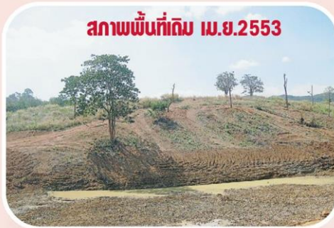
สภาพพื้นที่เดิม เม.ย.2553

ระหว่างเลือกหาสถานที่บังเอิญคนในสมาคมฯ รู้จัก กับเจ้าของที่ 2 แปลงนี้ ที่มีความเหมาะสมจะสร้าง สวนแบบนี้ จึงมีการติดต่อเจรจาขอใช้สถานที่ เจ้าของที่ดินยินยอมให้ใช้พื้นที่ฟรี แลกกับ ตัวเองได้เปลี่ยนอาชีพมาทำสวนเกษตรเพื่อการ ท่องเที่ยวทำสวนไม้ดอก น่าจะดีกว่าปลูกข้าวโพด เพราะทางสมาคมฯออกค่าใช้จ่ายให้หมด ในการ เปลี่ยนเขาหัวโล้นให้เป็นสวนสวย ทั้งปรับปรุง พื้นที่ดิน ปรับภูมิทัศน์ นำไม้ดอก ไม้ยืนต้น