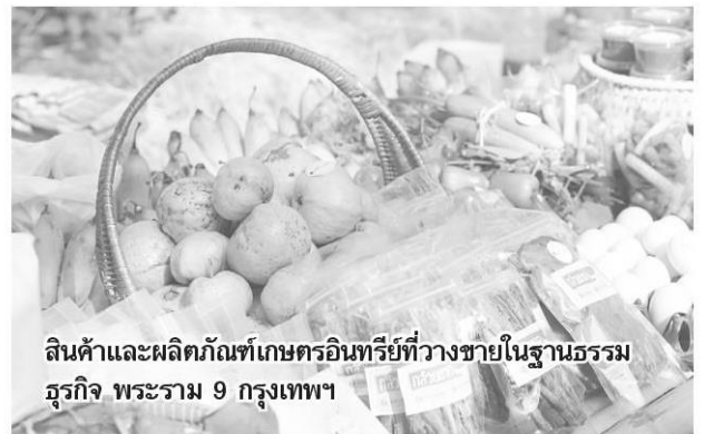
สินค้าและผลิตภัณฑ์เกษตรอินทรีย์ที่วางขายในฐานธรรมธุรกิจ พระราม 9 กรุงเทพฯ

กิจกรรมที่ 2 มีขึ้นที่บ้านสวนอสิริย์เกษตรอินทรีย์และฟาร์มม้าเมืองจันท อ.ท่าใหม่ จ.จันทบุรี ของนางแววศิริ ฤทธิโยธี เมื่อเดือน มิ.ย. มีผู้เข้าร่วมกิจกรรมประมาณ 500 คน มุ่งให้ความรู้เรื่องเกษตรอินทรีย์ปลอดภัย ซึ่งแม้แต่ฟาร์มขนาดใหญ่ 200 ไร่ก็สามารถทำได้ ซึ่งผลผลิตจากฟาร์ม ทั้งเงาะ ทุเรียน ลองกอง ล้วนเป็นผลไม่ปลอดสารพิษ เกษตรอินทรีย์ เป็นตัวอย่างสะท้อนให้เห็นว่าเกษตรอินทรีย์สามารถทำได้แม้จะเป็นพื้นที่ขนาดใหญ่ และผลผลิตของสวนยังได้รับการรับรองมาตรฐาน PGS (Participatory Guarantee System) หรือการรับรองมาตรฐานเกษตรอินทรีย์แบบมีส่วนร่วมจากกลุ่มเกษตรกรอินทรีย์ด้วยกันเองที่