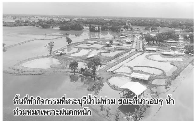
พื้นที่ทำกิจกรรมที่สระบุรีน้ำไม่ท่วม ขณะที่น่ารอบๆ น้ำท่วมหมดเพราะฝนตกหนัก

ผลสำเร็จในปีที่ 6 อาทิตย์ กริทธิพรธ ผู้จัดการใหญ่ฝ่ายสนับสนุนธุรกิจ บริษัท เซฟรอนฯ กล่าวว่า เป็นที่น่าภาคภูมิใจที่โครงการดำเนินมาถึงปีที่ 6 และมีผู้ตอบรับแนวคิดนี้จำนวนมาก แม้จุดเริ่มต้นจะมาจากกรณีที่พระบาทสมเด็จพระปรมินทรมหาภูมิพลอดุลยเดช บรมนาถบพิตร ในหลวง ร.9 ทรงห่วงแม่น้ำป่าสัก เป็นการไฟ้กสูงสุดเดียว แต่ปัจจุบันแนวคิดนี้ได้แตกตัวไปทั่ว เกิดการเปลี่ยนแปลง และในปี 2561 ทำให้เกิดการเปลี่ยนแปลงใน 4 พื้นที่ คือ กรุงเทพฯ ราชบุรี จันทบุรี และน่าน มีการสร้างศูนย์การเรียนรู้ได้หลายแห่ง ทำให้ผู้ที่อาจจะแค่เคยได้ยินโครงการได้มีโอกาสสัมผัสของจริง ได้มีส่วนร่วมในการทำเกษตรตามแบบวิถีธรรมชาติ พอเพียง ได้เห็นการพลิกฟื้นเปลี่ยนแปลงของพื้นที่ที่ดำเนินโครงการ ที่สำคัญมีคนเข้าร่วมโครงการไม่ต่ำกว่า 2,500