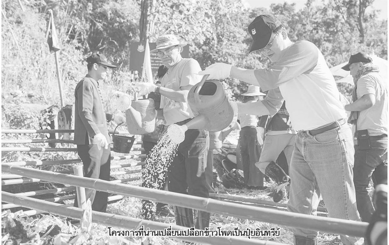
โครงการที่นำน้เปลี่ยนเปลือกข้าวโพดเป็นปุ๋ยอินทรีย์

โ ครงการพลังคนสร้างสรรค์โลก รวมพลังตามรอยพ่อของแผ่นดิน หรือโครงการตามรอยพ่อของแผ่นดิน ปีที่ 6 ซึ่งเป็นปีสุดท้ายของระยะที่ 2 ในแผนหลัก 9 ปีได้ปิดฉากลง พร้อมกับการประกาศว่าจะสานต่อโครงการในปีที่ 7 ในปี 2562